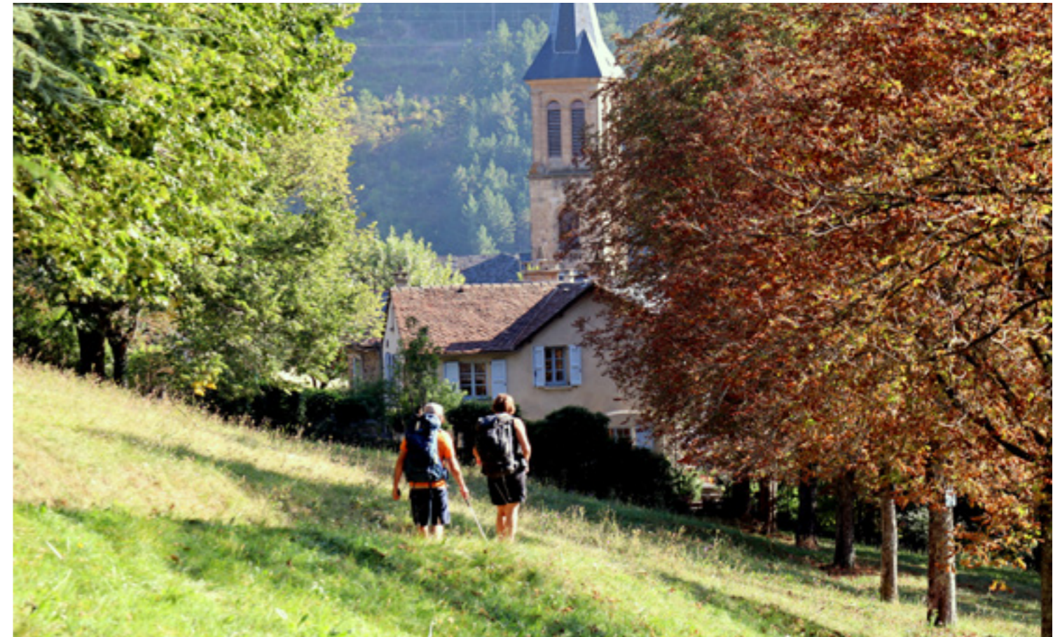
Chemin de Stevenson

Un espace pique-nique est aménagé d'une grande table et de bancs fixes accessibles à tous. Le site est idéal pour écouter les sons de la forêt, sentir les parfums des bois et se laisser imprégner par l'atmosphère du lieu. Un cône d'écoute géant amplifie les « musiques » environnantes pour les personnes en situation de handicap auditif.