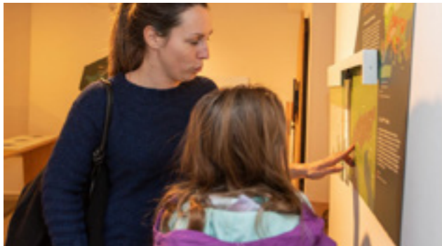
Exposition « Faune d'altitude » à la maison du Parc national à Briançon

Véritable parcours de découverte interactif, « Scènes d'altitude » met les sens en éveil. Le bouquetin, le blanchon et le lagopède, trois espèces d'altitude emblématiques du massif des Ecrins, se « cachent » dans les différentes salles. Des indices visuels, sonores ou à toucher invitent les visiteurs à mieux les connaître. Une scénographie qui confère désormais une belle dynamique à l'étage de cet espace d'accueil des publics, situé au cœur de la cité historique de Briançon qui accueille près de 50 000 visiteurs par an.