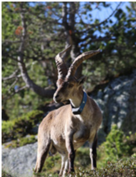
Bouquetin ibérique

Action prioritaire de la "Stratégie pyrénéenne de valorisation de la biodiversité", le programme de réintroduction du bouquetin ibérique, soutenu par GMF, repose sur une étroite collaboration franco-espagnole-andorrane.