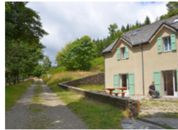
Gîte « Aire de Côte »

Au Parc national des Cévennes : le gîte d'étape « Aire de Côte » à Bassurels