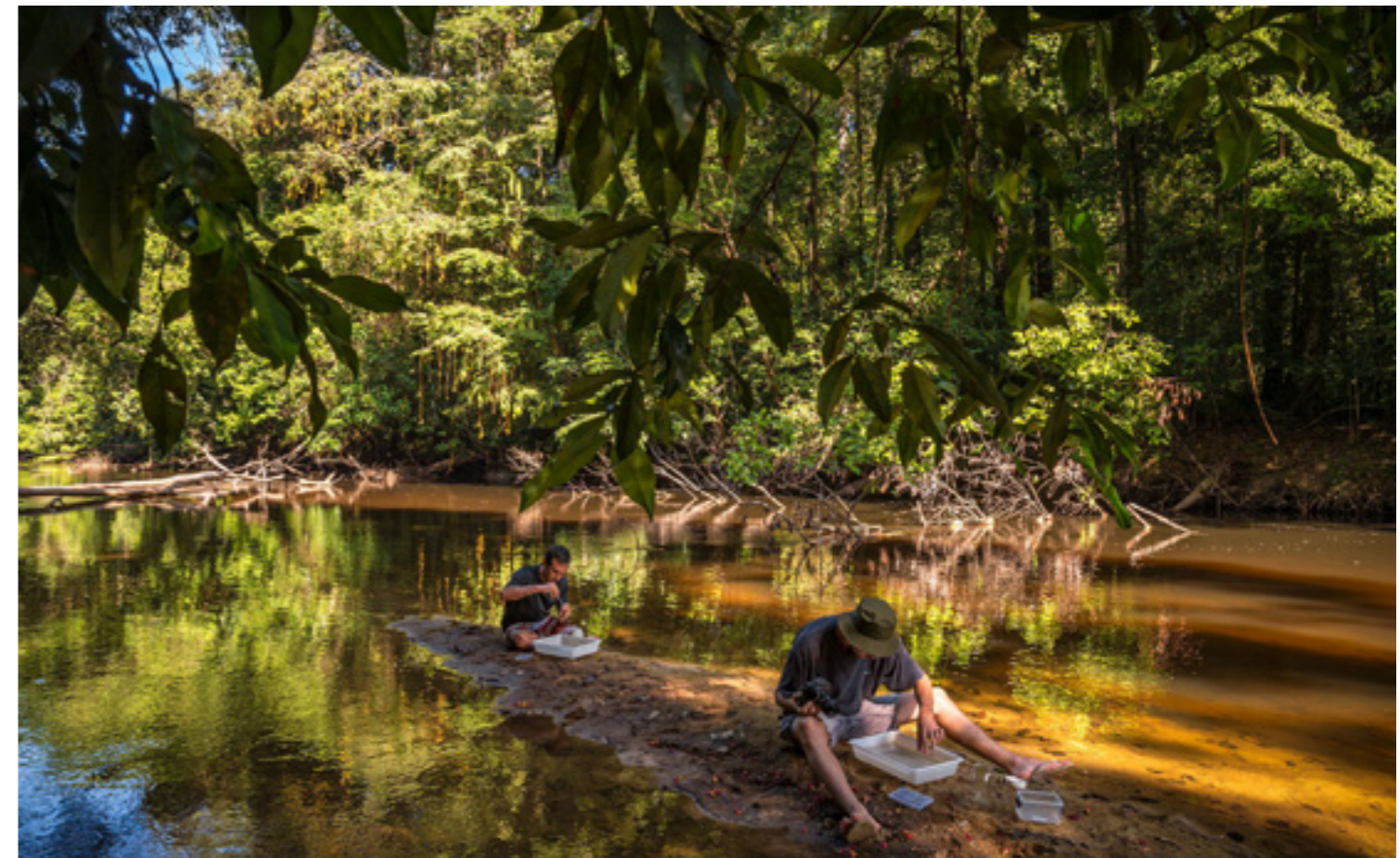
Mission de découverte au Haut Coursibo

Le Haut Coursibo (Guyane) est une zone forestière située entre le cœur du Parc amazonien et la Réserve naturelle nationale de la Trinité.