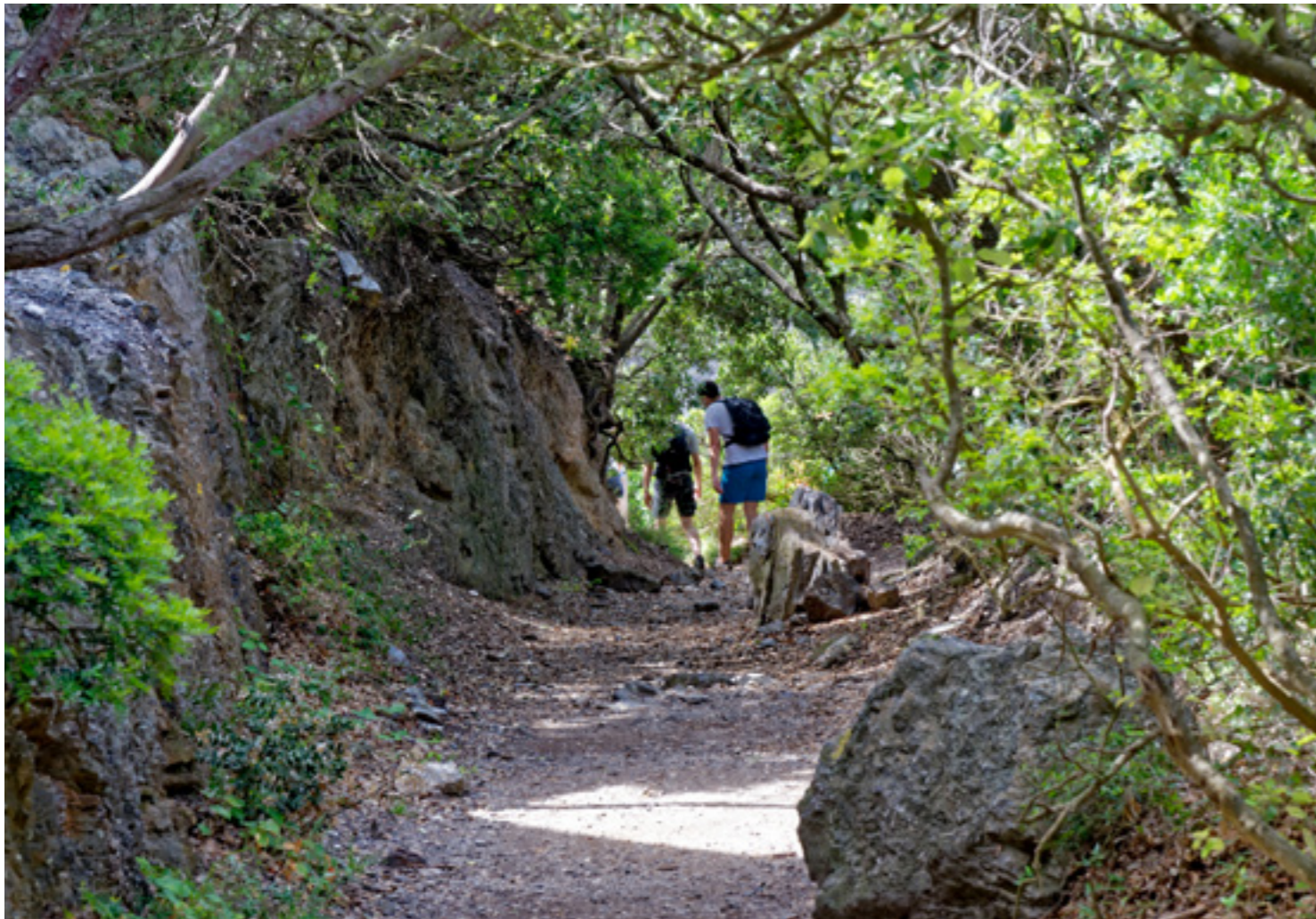
Sentier sur la presqu'île de Giens