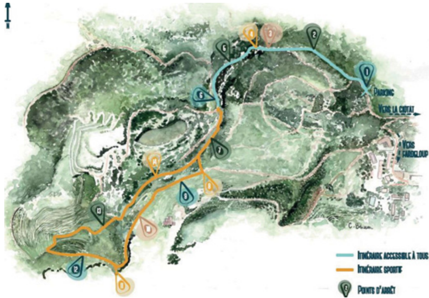
Itinéraires de la promenade de la carrière du Loin