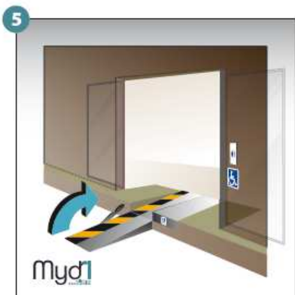
5 - Basculer la poignée qui fera office de chasse roues.