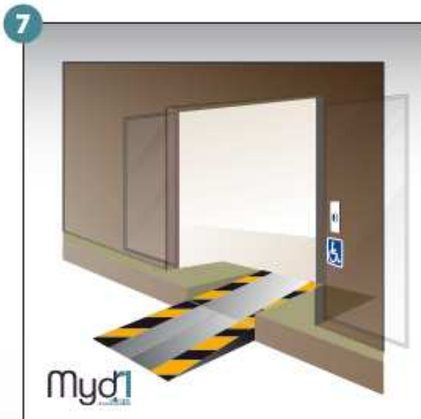
7- Rampe en service.