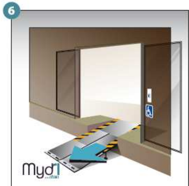
6 - Répéter les opérations pour le deuxième volet