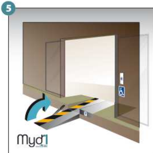
5 - Basculer la poignée qui fera office de chasse roues.