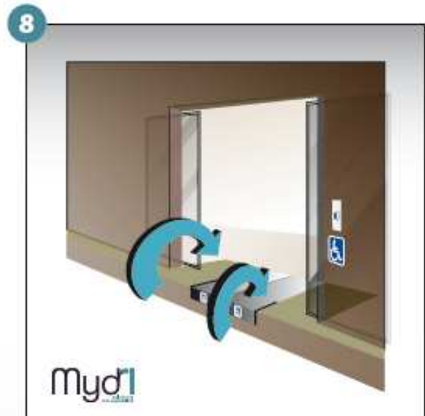
8 - Répéter les manoeuvres précédentes en sens inverse pour fermer la rampe.