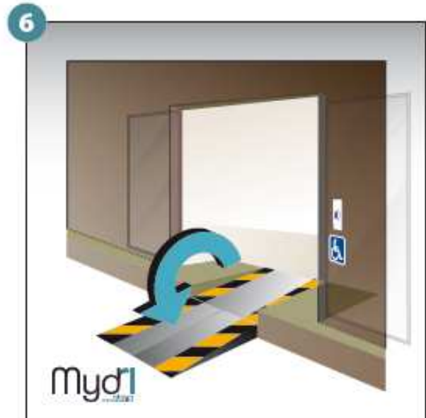
6 - Répéter les opérations pour la deuxième rampe.