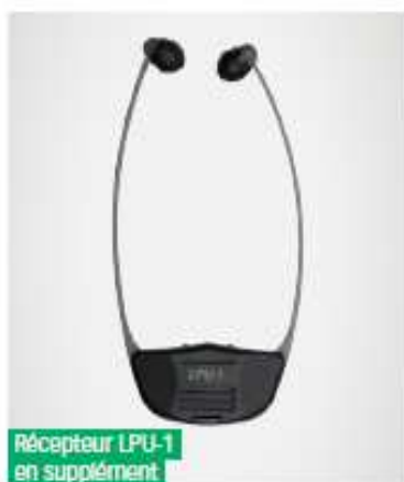
Récepteur LPU-1 en supplément